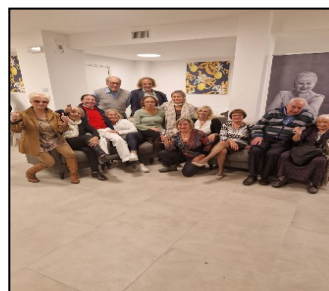
Il nostro gruppo di teatro