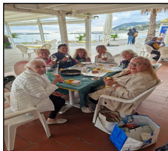
Burraco al mare....