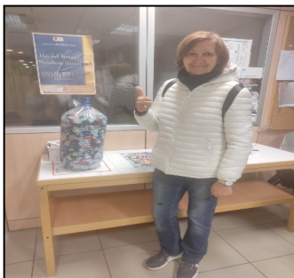
Raccolta tappi in plastica